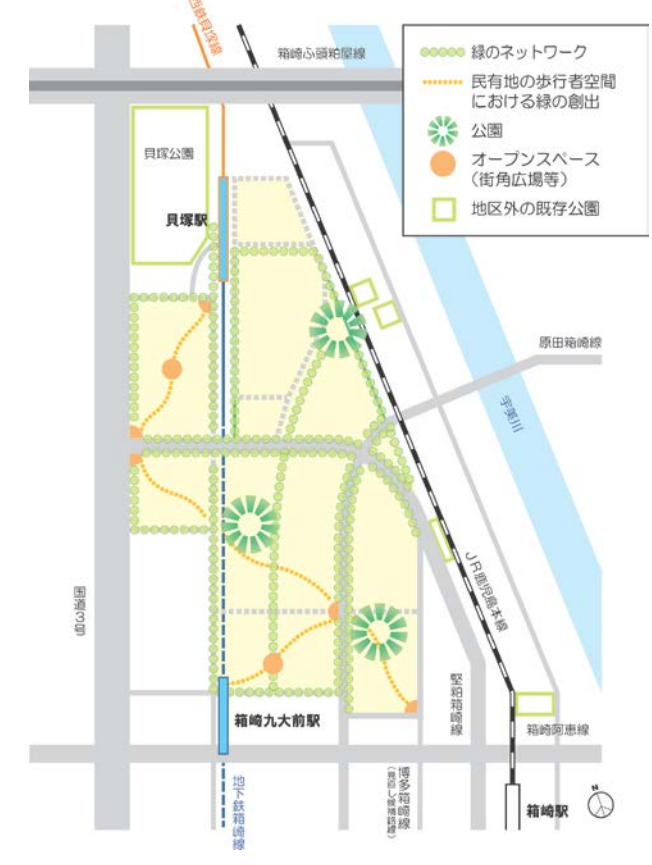
【緑のネットワーク形成方針(案)】